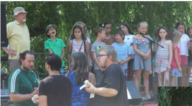
Grundschulchor vor dem Auftritt - Stimmung am See