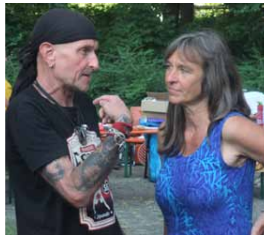
Stadtteil und Kirche im Gespräch mit den Katzen der Bastille!

Und nun wünschen wir Ihnen viel Spaß bei den Bildern und Impressionen zum Fest. Rebecca Melchionda (Praktikantin im Wiesprojekt)