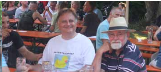
Der Chef im Gespräch während „Mister Five“ rockt!